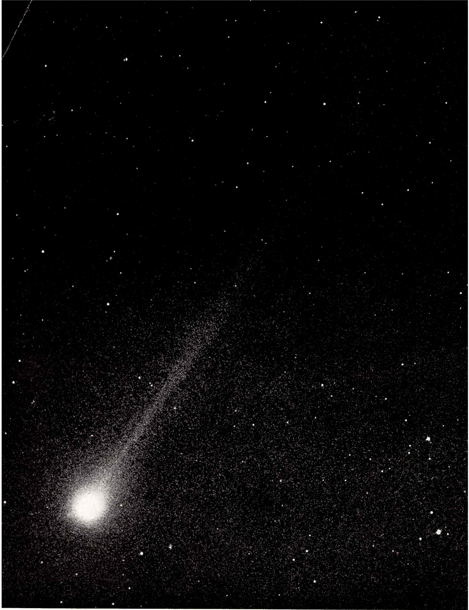
Austinova kométa 1982g fotografovaná 25. augusta Schmidovým teleskopom 60/90/180 cm observatória Konkolyho astronomickeho ústavu Maďarskej akadémie vied na Pizskésteľô v pohorí Mátra v integrálnom svetle na platňu Eastman Kodak 103a-0 pri expozícii 10 min. 20 s. Stred expozície je 19^{\text{h}}47^{\text{m}}10^{\text{s}}\text{UT} . Pozorovacie podmienky boli dosť nepriaznivé nielen pre malú výšku kométy nad obzorom, ale najmä pre súvislú vrstvu cirrov.