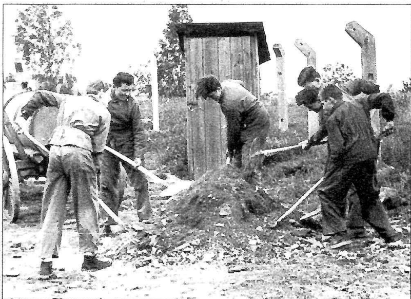
Členové astronomického kroužku odpracovali mnoho brigádnických hodin